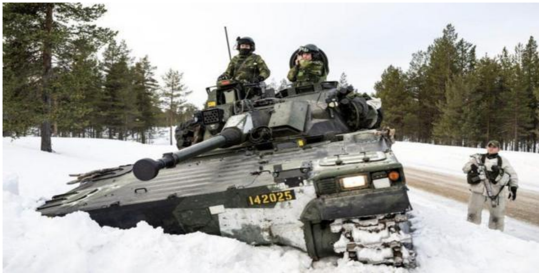
Figura N°2 Ingreso de Suecia en la OTAN.