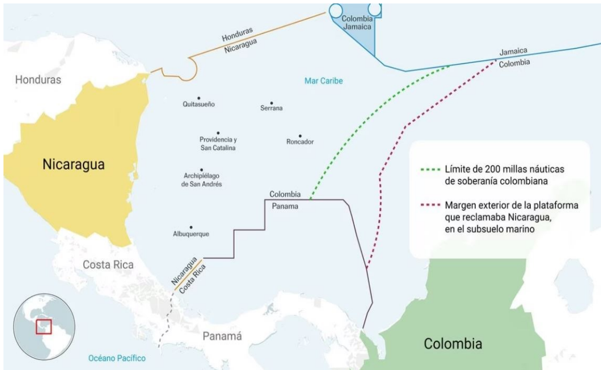
Mapa de la zona marítima en disputa entre Nicaragua y Colombia